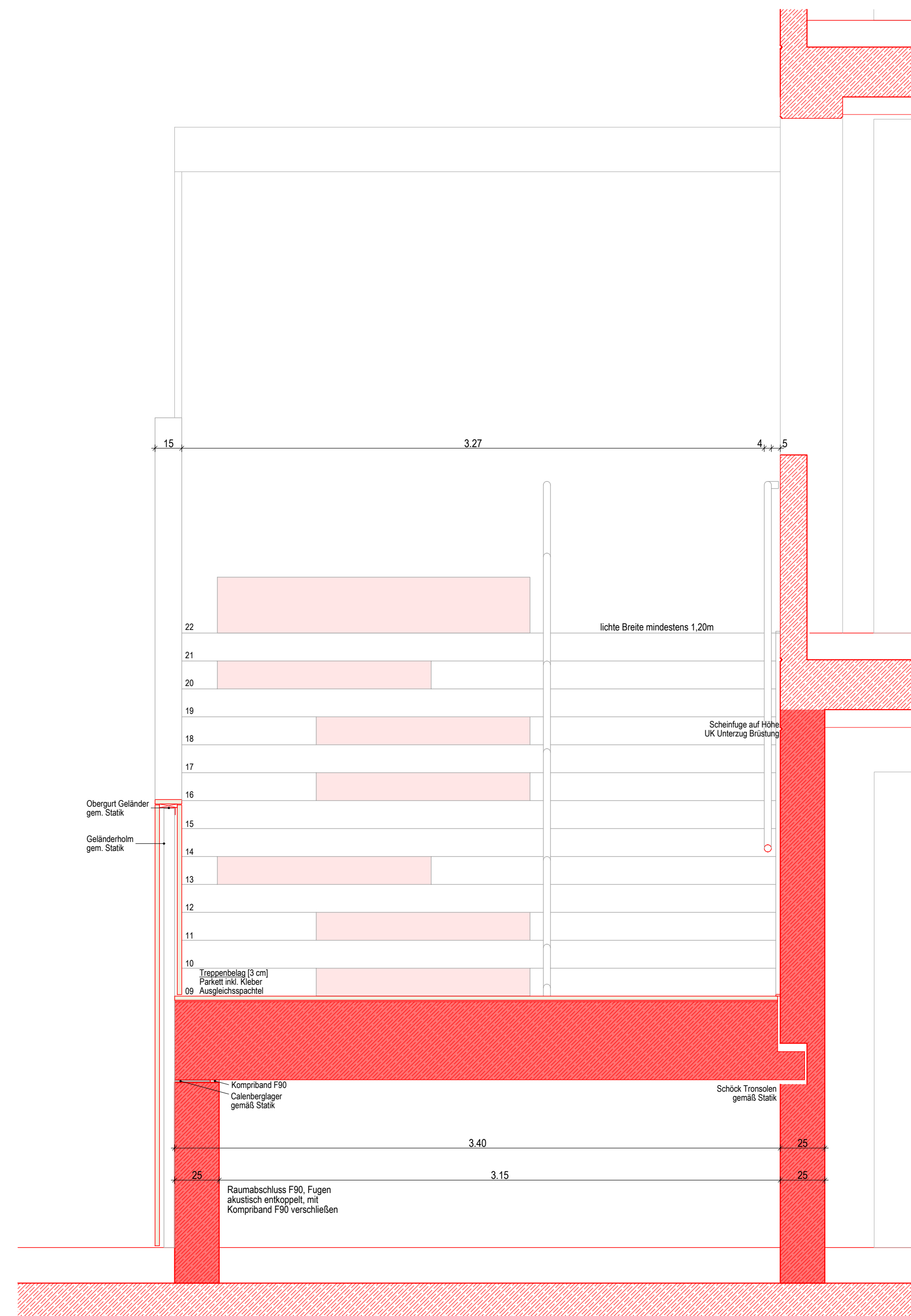
Schnitt 1-1 1:20